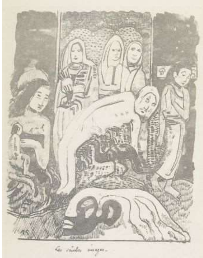
Les saintes images.