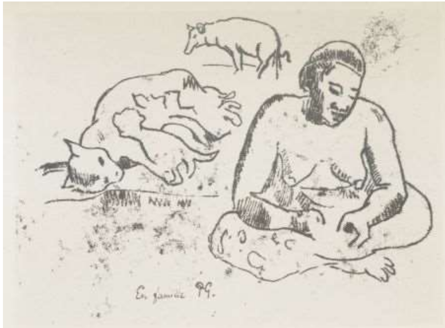
En famille PG.

Vous voulez savoir qui je suis: mes œuvres ne vous suffisent-elles pas? Même en ce moment où j'écris je ne montre que ce que je veux bien montrer.