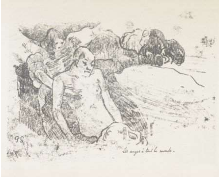
Les anges à tout le monde.