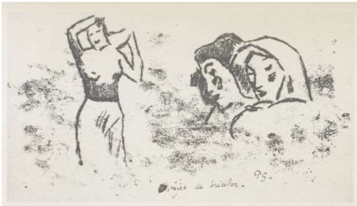
Histoire de bricoler PG.

«Empare-toi de cet héritage, l'hostie à la main,» et il s'en empare.