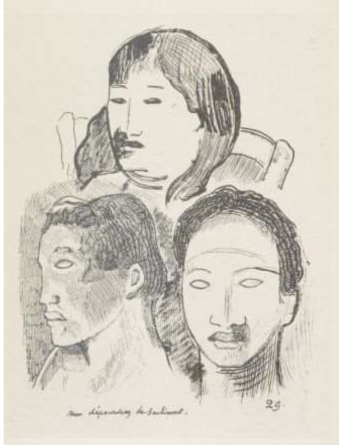
Non dépourvues de Sentiment.