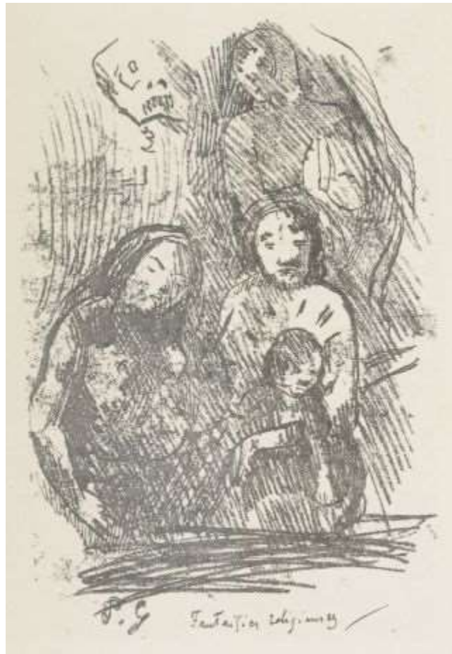
P.G Fantaisies religieuses

Cette jeune Danoise prenait ses repas à la crèmerie d'en face sans jamais quitter ses gants. Une