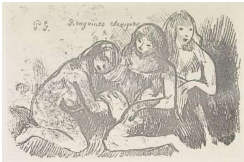
P.G. Rengaines classiques