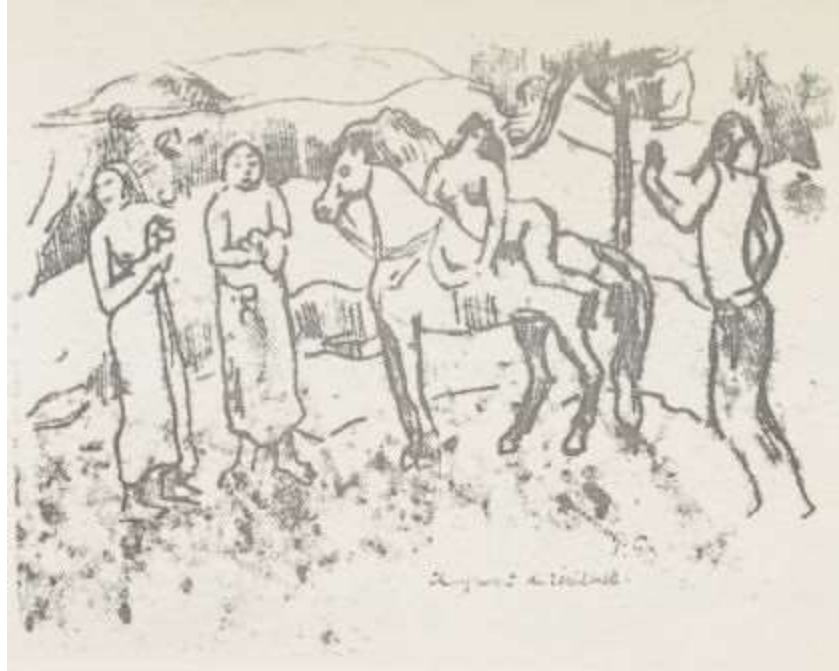
Changement de résidence.