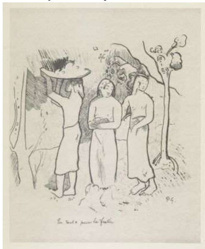
En route pour le festin

La colère, l'indignation, la douleur aussi, et la honte de tous ces regards qui déchiraient toute ma personne, m'étouffaient et c'est en balbutiant que je dis: «C'est bien, Monsieur, montons et nous nous expliquerons là-haut.» Dans le lit Vincent gisait complètement enveloppé par les draps, blotti en chien de fusil: il semblait inanimé. Doucement, bien doucement, je tâtai le corps dont la