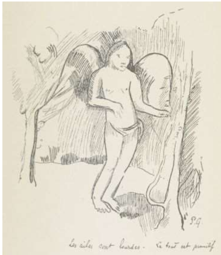
Les ailes sont lourdes. Le tout est primitif