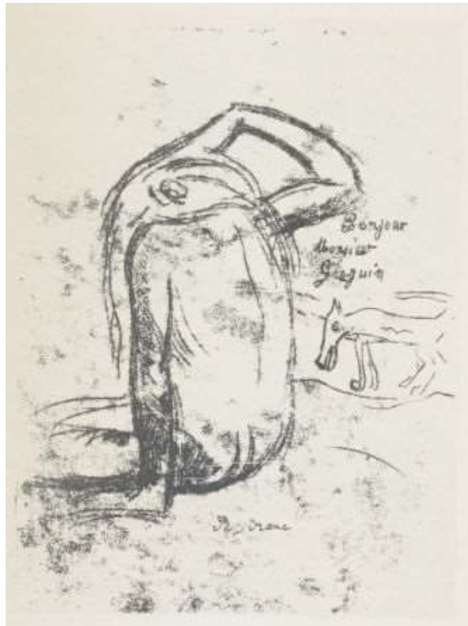
Bonjour Monsieur Gauguin